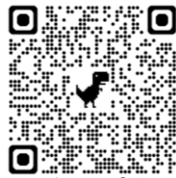
網上報名 QR code

【報名表所得之個人資料只用於有關用途，除法例規定外，個人資料不會作其他用途或向外間披露。】